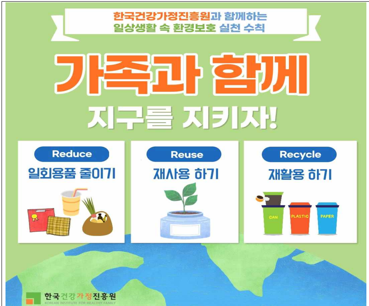
▲Reduce(일회용품 줄이기), ▲Reuse(재사용하기), ▲Recycle(재활용하기)