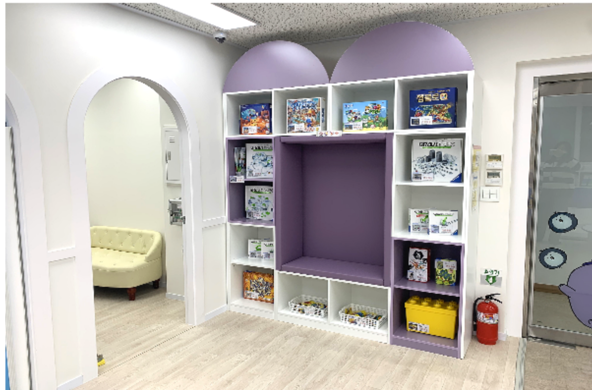
보드게임과 과학놀이 교구