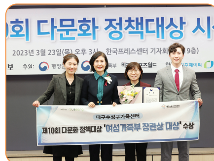
세계일보 다문화정책대상, 여성가족부 장관상 대상 수상