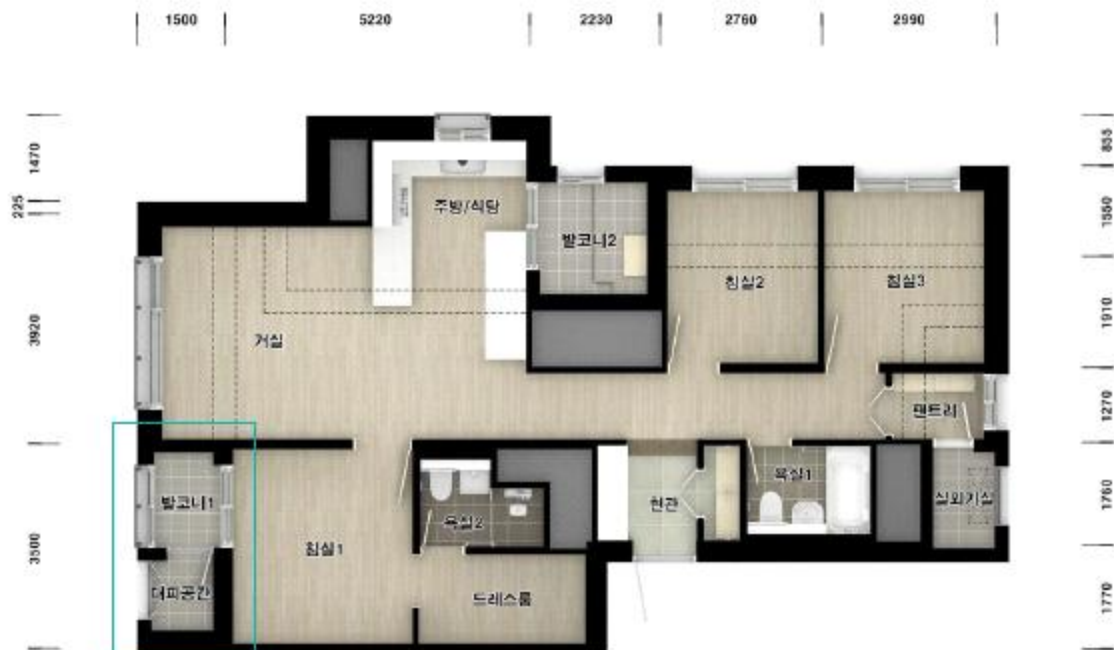
4층 ~ 최상층