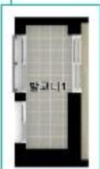
1층 ~ 2층